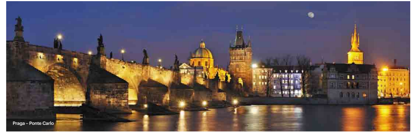
Praga - Ponte Carlo