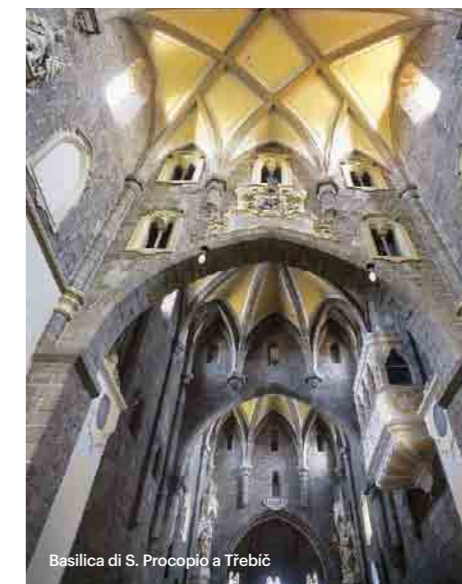
Basilica di S. Procopio a Třebíč

Lo sapevate che nella città di Telč, grazie alla sua bellezza, sono stati girati molti film cechi e stranieri? E quante storie cinematografiche sono state girate al castello del luogo!