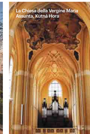
La Chiesa della Vergine Maria Assunta, Kutná Hora

Le strade che da Praga portano ai gioielli storici del Paese sono dirette verso tre punti cardinali. Sono tutti a portata di mano, a meno di un'ora di viaggio. Tre testimonianze del passato lontano.