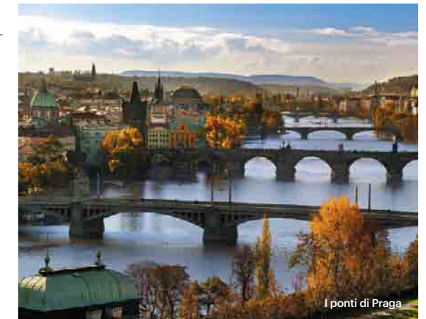
I ponti di Praga

e chissà che poi, col tempo, si svelino come per magia alcuni dei suoi segreti più reconditi. www.praguewelcome.cz