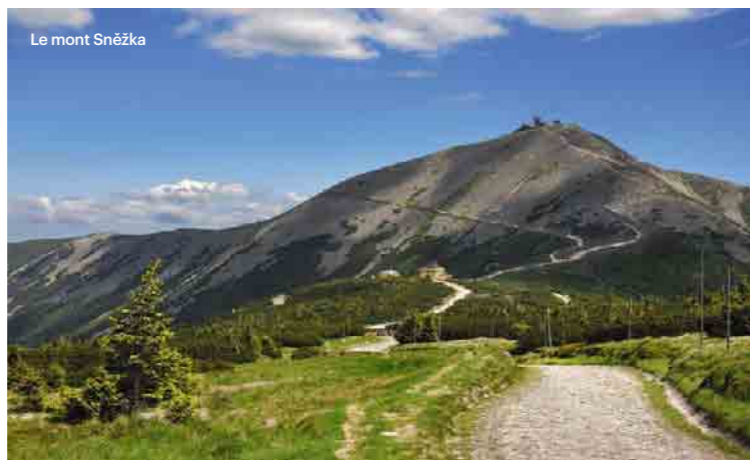
Le mont Sněžka

Troverete il luogo denominato la sorgente del grande fiume Elba presso Labská louka, sui Monti dei Giganti. Recatevi lì per esempio partendo dal più grande centro abitato dei Monti dei Giganti, Špindlerův Mlýn attraverso il sentiero che conduce alla magica Labský důl. Il luogo è decorato dagli stemmi delle città attraversate dall'Elba.