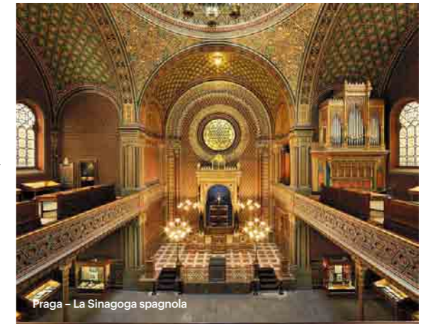
Praga - La Sinagoga spagnola

La regina delle città ceche è certamente Praga, la bella dalle cento torri, considerata uno dei luoghi più belli al mondo. Chi conosce solo Praga, però, si perde molto. Tutto il Paese è disseminato di tanti tesori interessanti e spesso unici, ed è davvero difficile conoscerli tutti in una sola vita. Esistono molte chiavi per aprire la porta della Repubblica Ceca. Le pagine che state per sfogliare l'apriranno con la chiave del patrimonio culturale mondiale dell'UNESCO. Ecco che la chiave gira nella serratura, la porta si apre, e voi potete finalmente entrare nel Paese delle meraviglie e delle bellezze.