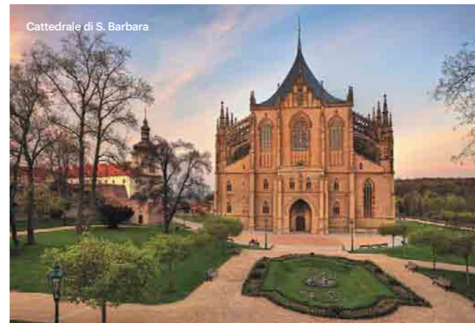
Cattedrale di S. Barbara