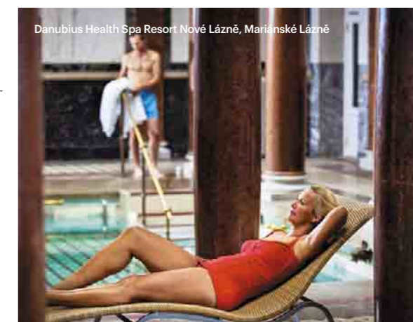
Danubius Health Spa Resort Nové Lázně, Mariánské Lázně

Toccate le stelle! Il festival internazionale del cinema di Karlovy Vary fa parte dei più prestigiosi festival del cinema che vantano una fama eccellente. Ogni anno all'inizio di luglio potrete vedere con i vostri occhi attori e registi che sfilano sul tappeto rosso, e chiaramente potrete andare al cinema per proiezioni di qualità. www.kviff.com