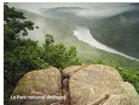
Le Parc national de Podyjí

Krkonoše (I Monti dei Giganti), la più alta catena montuosa ceca, sita nel nord del Paese, con il monte Sněžka alto 1603 metri, è la casa di innumerevoli specie animali e vegetali, in mezzo a circhi glaciali ripidi, estesi prati montuosi e cascate. Podyjí, nel sud della Moravia, è una vallata del fiume Dyje con meandri scavati in profondità, pareti rocciose