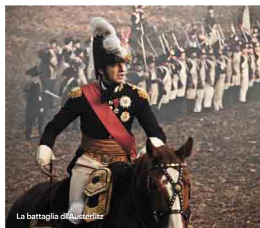
La battaglia di Austerlitz

Ammirate le bellezze locali in bici! I comodi sentieri di Lichtenštejn vi condurranno per tutto il complesso culturale di Lednice-Valtice e vi consentiranno di visitare tutti i monumenti: i romantici castelli di Lednice e Valtice, il segreto castello di Janův hrad, il castello Rendezvous e molti altri ancora. Scoprite il genius loci che si nasconde in questo paesaggio culturale.