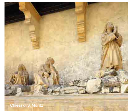
Chiesa di S. Moritz