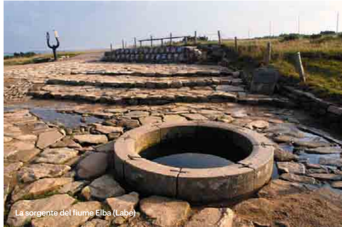
La sorgente del fiume Elba (Labe)

In questo piccolo Paese ci sono così tante bellezze che quasi non ci si crede. La varietà del paesaggio ceco è davvero sorprendente, e la vetrina di questa varietà sono i quattro parchi nazionali, ognuno di essi unico e diverso.