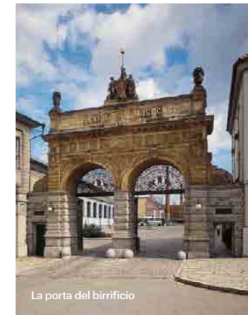
La porta del birrificio

Vi consigliamo di fare una visita al birrifico Pilsner Urquell, oppure di visitare il Museo del Birrificio che si trova nel centro della città. Scoprite la storia della birra dall'antichità ai giorni nostri! www.prazdrojvisit.cz