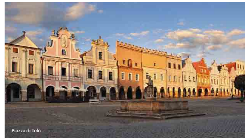
Piazza di Telč