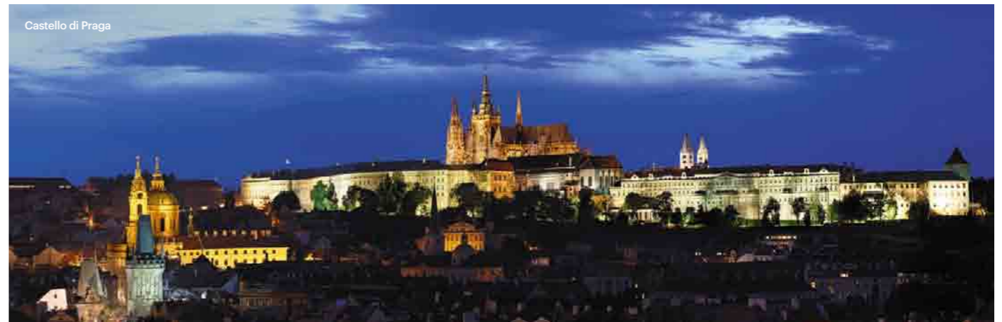
Castello di Praga

Di nessuna città ceca si è scritto e raccontato così tanto quanto di Praga, la metropoli del Paese. Stare su uno dei più bei ponti in pietra del mondo, il Ponte Carlo, guardando in alto attraverso le sagome delle statue silenziose e visitare la Città Vecchia, piena di vicoli sinuosi e piazze affascinanti, dove risplende sulla collina il Castello di Praga con la cattedrale di San Vito, è un'esperienza che non lascia indifferenti neanche quelli che vivono qui da sempre.