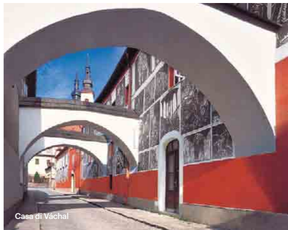
Casa di Váchal

Nella Boemia orientale, in una regione leggermente ondulata piena di sole, sorge la piccola cittadina di Litomyšl, che ospita un palazzo incluso nel patrimonio culturale mondiale UNESCO. La storia ha lasciato una serie di notevoli beni culturali armoniosi e pittoreschi.