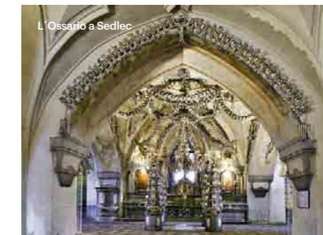
L'Ossario a Sedlec

Ascoltate la storia della costruzione della cattedrale, scritta cinquecento anni fa e spesso violata dagli eventi storici. La cattedrale di S. Barbara è stata destinata sin dalle origini ad essere un edificio di rappresentanza costruito con il patrocinio dei ricchi borghesi di Kutná Hora. La sua costruzione esprime le tensioni dell'epoca tra Kutná Hora e Praga e anche tra Kutná Hora e il potente convento nella vicina Sedlec. Questa maestosa costruzione toglie tuttora il respiro con la sua architettura esterna e con i ricchi affreschi dell'interno. www.guide.kh.cz