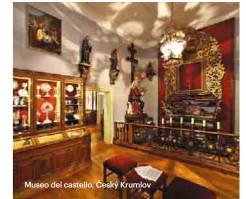
Museo del castello, Český Krumlov

Una delle più belle città storiche europee, inclusa nella Lista del patrimonio culturale e naturale mondiale UNESCO, giace nella Boemia meridionale e, dalle sue mura, è ben visibile la Selva boema ed il «mare ceco» – lo stagno artificiale di Lipno.