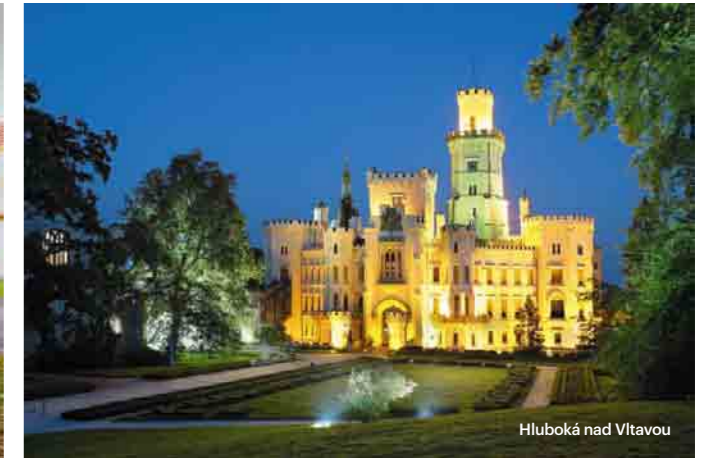
Hluboká nad Vltavou

Una delle più belle città storiche europee, inclusa nella Lista del patrimonio culturale e naturale mondiale UNESCO, giace nella Boemia meridionale e, dalle sue mura, è ben visibile la Selva boema ed il «mare ceco» – lo stagno artificiale di Lipno.