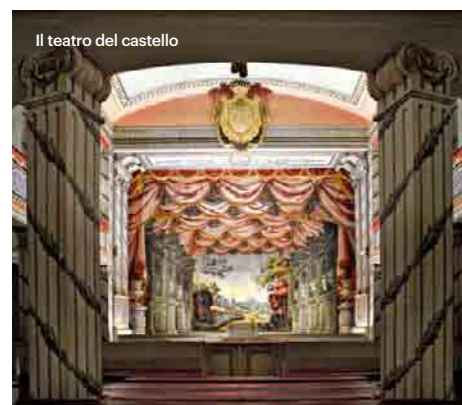
Il teatro del castello

Lo sapevate che oltre alla grande eredità artistica la musica ceca ha contribuito con altre piccole perle come la famosa Beer Barrel Polka (Rosamunde), diventata durante la seconda guerra mondiale inno dei soldati di entrambi i fronti? Con il titolo di Danno d'amore (Škoda lásky) già nel 1927 era stata composta dal compositore e maestro Jaromír Vejvoda come sua prima canzone.