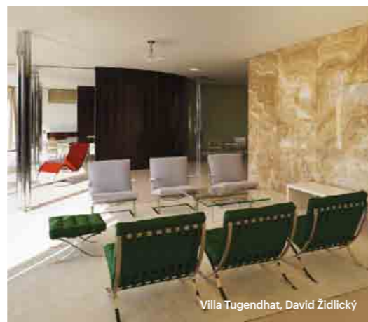
Villa Tugendhat, David Židlický

Ammirate le bellezze locali in bici! I comodi sentieri di Lichtenštejn vi condurranno per tutto il complesso culturale di Lednice-Valtice e vi consentiranno di visitare tutti i monumenti: i romantici castelli di Lednice e Valtice, il segreto castello di Janův hrad, il castello Rendezvous e molti altri ancora. Scoprite il genius loci che si nasconde in questo paesaggio culturale.