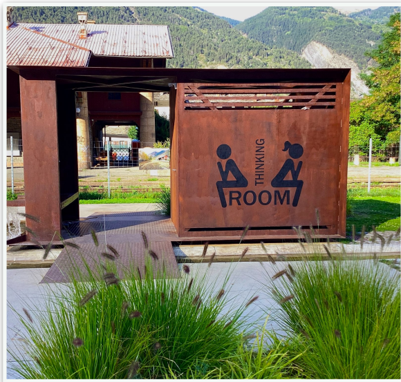
Servizi presenti all'interno del Parco della Lettura